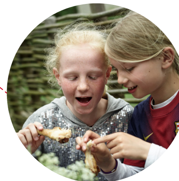
ROSKILDE KOMMUNE MAD OG MÅLTIDER I SKOLEN