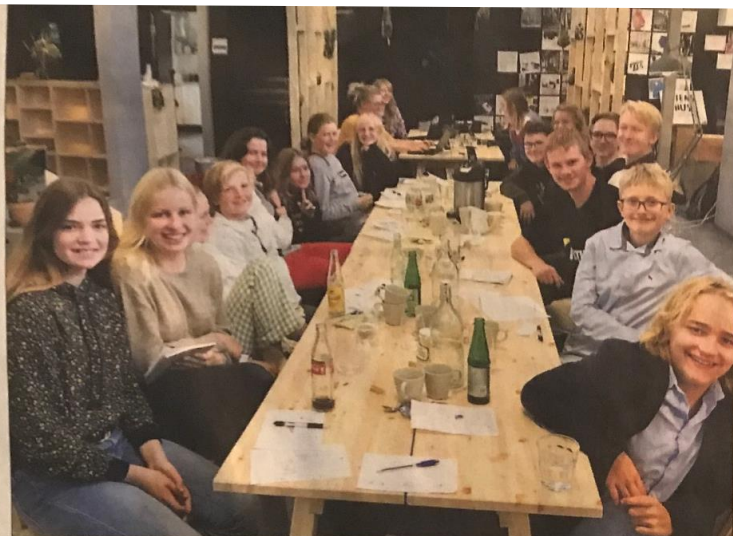
Det Fælles Elevråd i Gentofte har været afgørende for at indføre en særlig omfattende røgfri skolepolitik fra 2020.