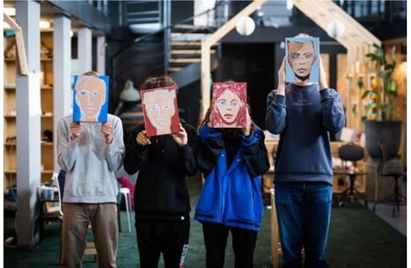
Fra dialogmøde med udskolingselever i "Ung i Byens Hus". Gentofte Kommune